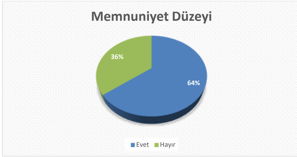
Grafik 1. Memnuniyet Düzeyi

aydınlatma, kalabalık ve mekanın fiziksel yapısı gibi faktörlerin güvenlik algısını etkilediğini belirtmiştir. Diğerleri, kamusal alanlarda var olan güvenlik önlemleri, kolluk kuvvetlerinin varlığı ve acil durum hizmetlerine erişim gibi unsurların güvenlik hissini artırdığını ifade etmiştir. Ayrıca, öğrencilerin kamusal mekanlardaki sosyalleşme ve eğlence olanaklarına yönelik görüşleri de incelenmiştir. Katılımcıların çoğu, özellikle açık alanlarda sosyal etkinliklerin ve etkileşim fırsatlarının sınırlı olduğunu belirtmiş, bu durumun hem sosyal yaşamlarını hem de genel memnuniyetlerini etkilediğini dile getirmiştir. Bu geri bildirimler, kamusal mekanların sosyal etkileşim ve eğlence açısından nasıl iyileştirilebileceğine dair önemli ipuçları sunmaktadır. Sonuç olarak, araştırma, Tokat'taki kamusal mekanların öğrencilerin günlük yaşamlarında nasıl bir rol oynadığını, bu mekanların güvenlik ve sosyal etkileşim açısından nasıl algılandığını ve bu algıların olumlu yönde nasıl geliştirilebileceğini anlamada değerli bilgiler sunmaktadır. Elde edilen bulgular, şehir planlaması ve kamusal alan tasarımı ile ilgili politika yapıcılar için önemli içgörüler sağlayarak, bu alanların daha güvenli, erişilebilir ve sosyal etkileşim için uygun hale getirilmesine katkıda bulunabilir. Katılımcılara “Kamusal mekanlar seni memnun edecek düzeyde mi?” sorulmuştur.